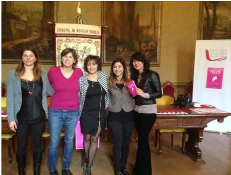
La presentazione del libro in Comune

REGGIO EMILIA. Il libro di un anonimo, non un libro anonimo, tantomeno nel titolo, "Giocare con le tette", stampato con i caratteri della Compagnia Editoriale Aliberti, nell'ambito di "Irene: progetto di sostegno allo sport femminile", che troverà nella finale di Champions League femminile 2016 a Reggio Emilia un evento-testimonianza di rilievo internazionale.